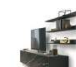
Mensole Super P. 236