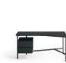
Scrivanìa Desk P. 264