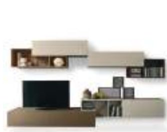
Tetris P. 136