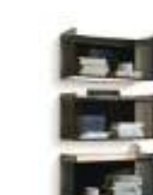
Mensole Domino P. 241