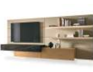
Boiserie TV P. 198