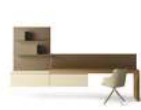
Pianali SP60 P. 247