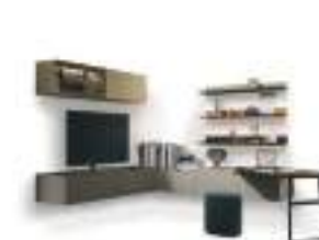
Scrittoio Girevole P. 258