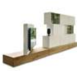
Roto P. 216