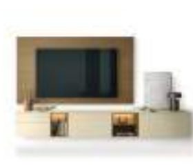
Pannello TV P. 190