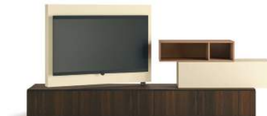
L7C76 - L/W 3000 x H 1435 x P/D 354/546