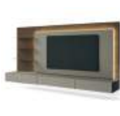
Ciak P. 200