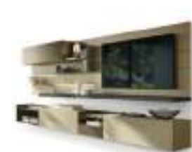
Agio P. 116