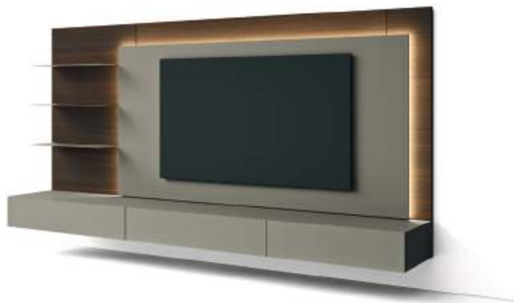
L7C65 - L/W 3000 x H 1680 x P/D 289/546