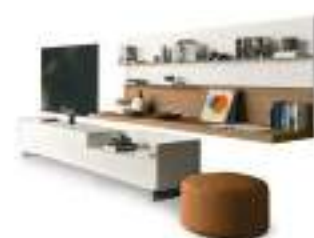
Cabaret Step P. 34