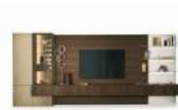
Boiserie P. 64