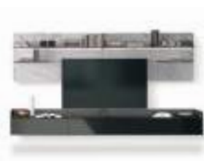
Cabaret One P. 06