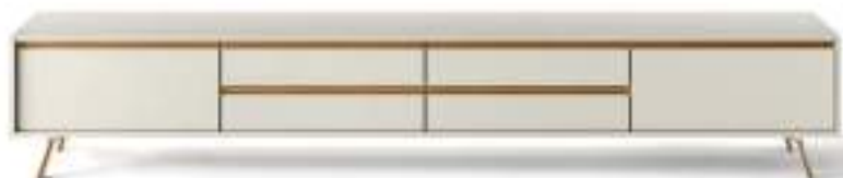
L7C46 - L/W 2430 x H 500 x P/D 561