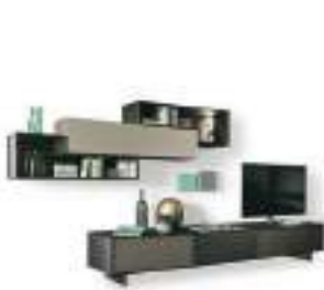
Riquadri P. 146