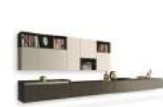
Open P. 106