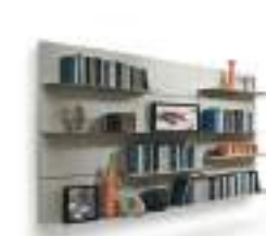
Mensole per Boiserie P. 228