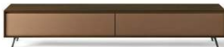
L7C46 - L/W 2430 x H 500 x P/D 561