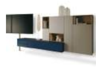
Video P. 206